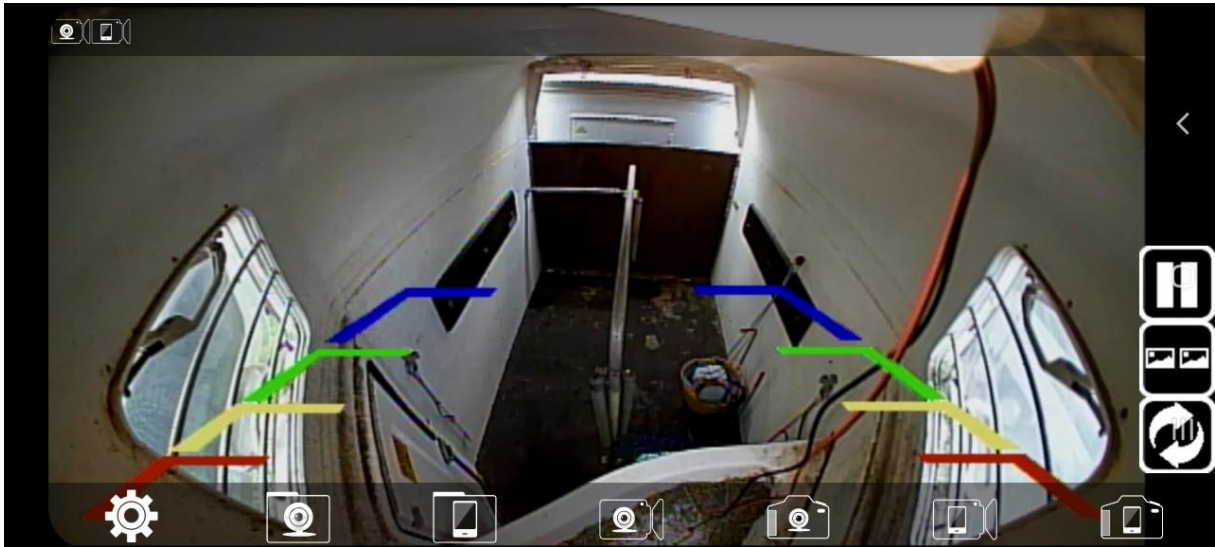
Voorbeeld op beeldscherm (de lijnen kun je uitzetten)